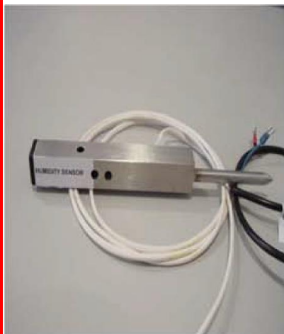
Figura 4 Sensor de Humidade

RH Accuracy: \pm 3.5\% RH, 0-100% RH non condensing, 25°C, 5 Vdc supply RH Interchangeability: \pm 5\% RH, 0-60% RH; \pm 8\% @60-100% RH Typical RH Hysteresis: \pm 3\% of RH Span Maximum RH Repeatability: \pm 0.5\% RH RH response time, 1/e: 15 s in slowly moving air @25 °C RH Stability: \pm 0.2\% RH Typical at 50% RH in 1 Year Supply Voltage: 4.0 Vdc to 5.8 Vdc Supply Current: 500 \mu A Max Operating Humidity Range: 0 to 100% RH, non condensing Operating Temperature Range: -40°C to 85°C (-40°F to 185°F)