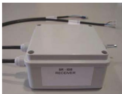
Figura 2 SR-IDS Recetor