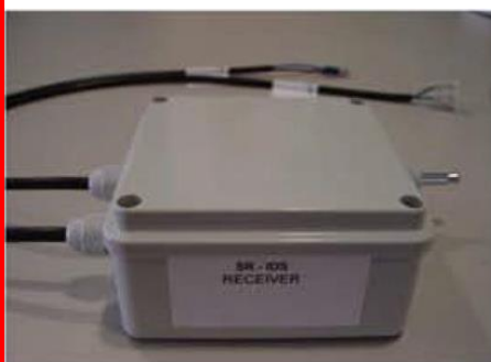
Figura 6 Recetor RF

PLL XTAL Design CMOS/TTL Output RSSI Output 12V Supply Voltage, 20 mA OUTPUT: 12V dc (Activate when positive Ice detection)