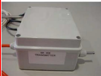
Figura 5 Transmissor RF

FM Radio Transmitter available as 433 MHz Transmit Range up to 250m Data Rate up to 9.6Kbps No Adjustable Components Very Stable Operating Frequency Operates from -20 to +85°C 12V de Supply Voltage, 20mA