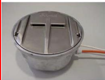
Figura 3 Sensor de Temperatura

Calibrated directly in ° Centigrade Linear +10.0 mV/°C scale factor 0.5°C accuracy guaranteeable (at +25°C) Rated for full – 55° to +150°C range Suitable for remote applications Low cost due to wafer-level trimming Less than 60 µA current drain Low self-heating, 0.08°C in still air Nonlinearity only +-1/4°C typical Low impedance output, 0.1W for 1 mA load