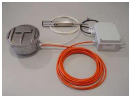
Figura 1 SR-IDS Transmissor

O SR-IDS é composto por dois dispositivos principais: O transmissor e o recetor. Estes dois dispositivos estão demonstrados na Fig. 1 e Fig. 2.